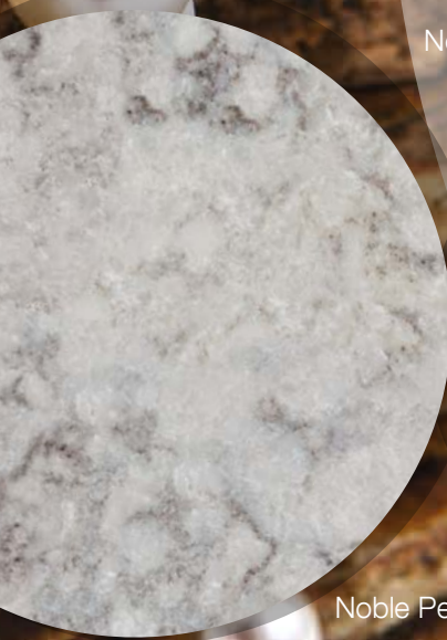
Noble Perlatto Luna