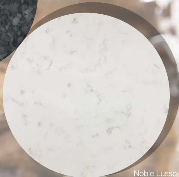
Noble Lusso Champagne