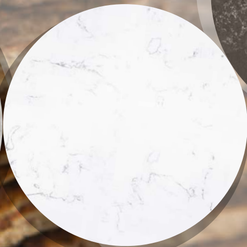
Noble Areti Bianco