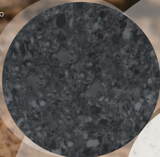
Noble Argos Nero